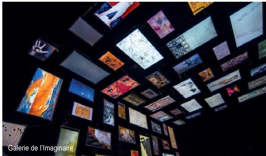
Centre International de l'Art Pariétal

Le site invite les visiteurs à admirer et ressentir l'émotion authentique de la grotte originale.