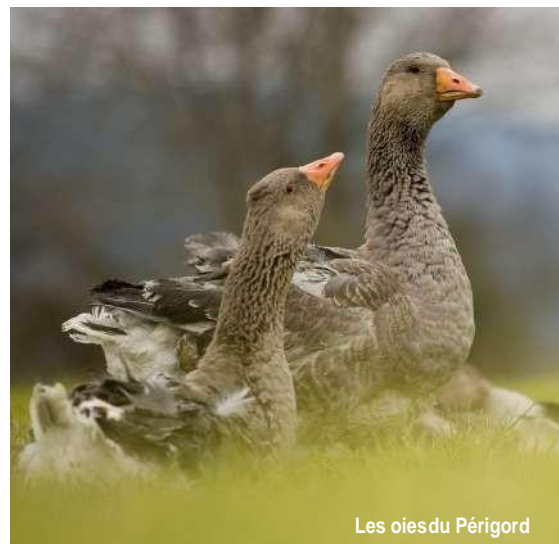
Les oies du Périgord